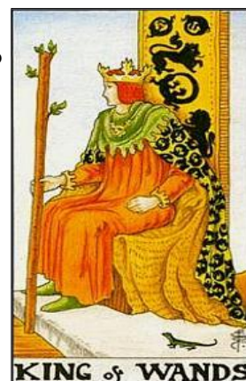
Tarocchi: Re di Bastoni = Onestà e Amicizia