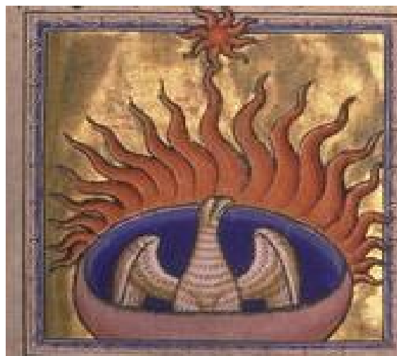
LA FENICE brucia in fiamme, da un antico bestiario medioevale)